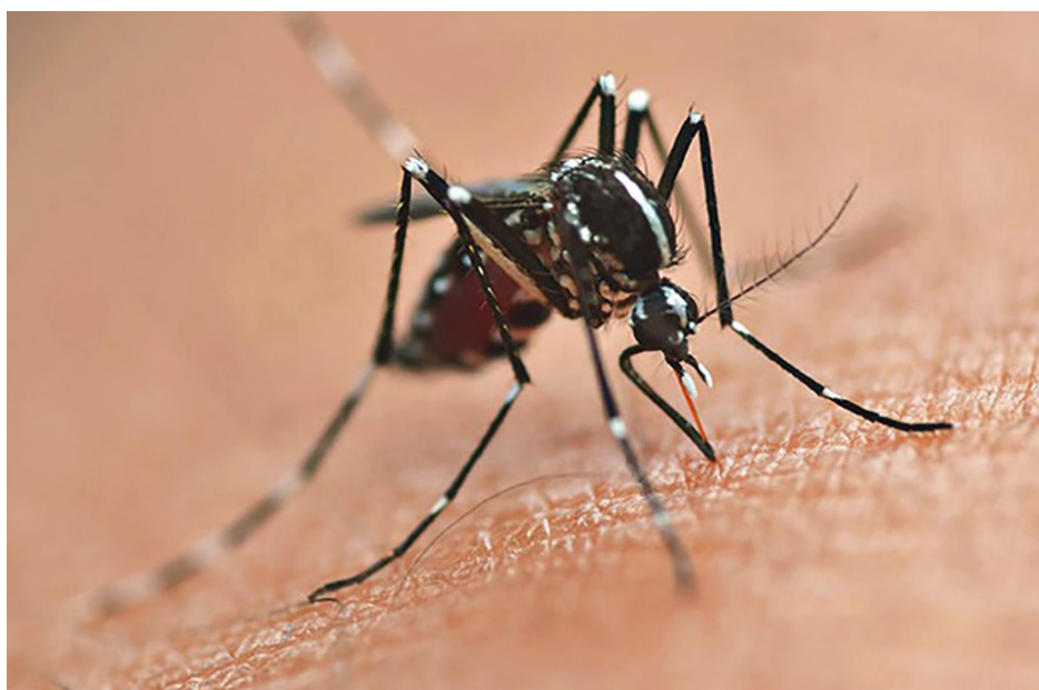
meses de janeiro até o dia 14 de março deste ano. O levantamento

A Secretaria de Estado da Saúde (Sesa) registrou uma queda de 52.193 para 2.028 nos casos confirmados de dengue no comparativo com mesmo período do ano passado, o que representa uma diminuição de 96,1%. O número de óbitos também caiu de forma expressiva e saiu de 90 mortes em 2025 para 1 neste ano, uma queda de 98,8%. Os dados do Setor de Arboviroses da Sesa compreendem a semana epidemiológica de 1 a 14 de 2026, que são os