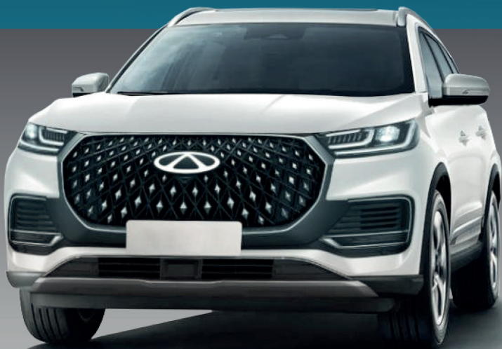
TIGGO 8 PRO PHEV

EMPLACAMENTO INCLUSO ✓ TANQUE CHEIO ✓ SEU USADO SUPER ✓ VALORIZADO NA TROCA!