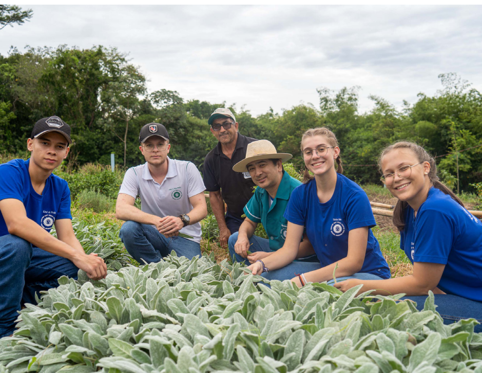
EQUIPE CORREIO REPORTAGEM LOCAL

O Governo do Estado, por meio da Secretaria da Educação (Seed-PR), está ampliando os investimentos em inovação e tecnologia voltados ao ensino agrícola. Somente nos últimos dois anos, cerca de R$ 8 milhões foram destinados à aquisição de maquinários e equipamentos modernos, como tratores, drones e novas tecnologias agrícolas, com o objetivo de fortalecer a formação técnica dos estudantes da rede estadual.