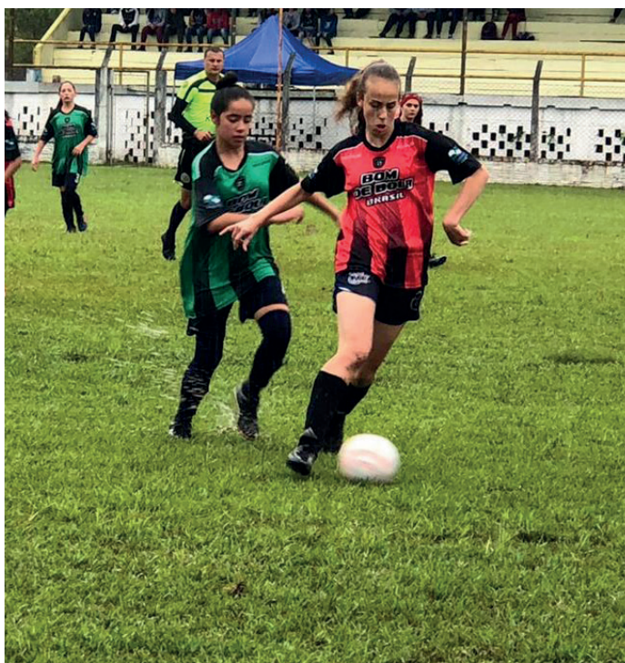
EQUIPE CORREIO REPORTAGEM LOCAL

Começa neste fim de semana a 2ª edição do Paraná Bom de Bola, competição de futebol de campo, masculino e feminino, realizada pelo Governo do Estado, por meio da Superintendência Geral do Esporte, com o apoio e parceria dos municípios.